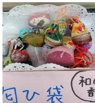
句ひ袋 (句ひ袋販売)

神戸ろうあ協会職員のご家族からたくさんのカレンダーを寄付いただき、それを100円で販売しました。家庭用のカレンダーからデスク用カレンダーまでデザインも豊富で、12月という時期もあり、あっという間に売れ、7,000円が集まりました。